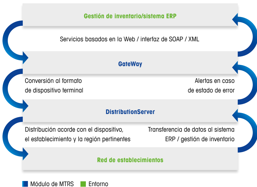
Diagrama de comunicación

“Mantenemos nuestros datos autenticados en la sede y los transferimos a cada uno de los puntos de venta con GateWay. Gestionando los datos de productos de forma centralizada, evitamos errores de etiquetado locales; imagínese el peligro que supondría no indicar correctamente la presencia de alérgenos”.